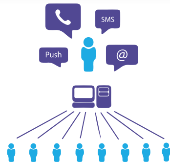
Sistema VIPER MASS